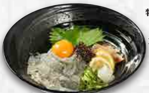
特選生しらす丼 880円 大盛 1,080円