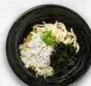
大和わかめのおうどん 冷たいおうどん 680円