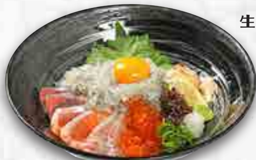
生しらす特選海鮮丼 1,780円 大盛 1,980円