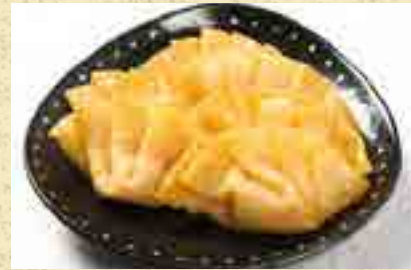
しらす明太チーズの包み揚げ 480円