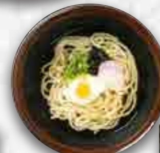
月見のおうどん 680円