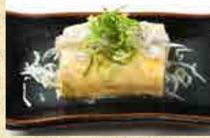
だし巻玉子のしらすあんかけ 480円