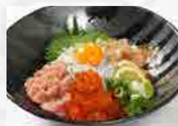
釜揚げしらす & ねぎとろいくら丼 1,380円 大盛 1,580円