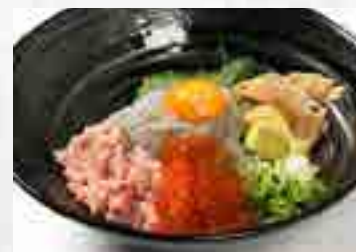
生しらす & ねぎとろいくら丼 1,480円 大盛 1,680円