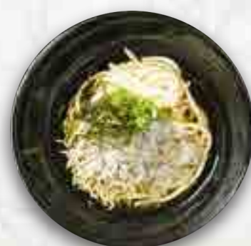
生しらすと釜揚げしらすの 冷たいおうどん 980円