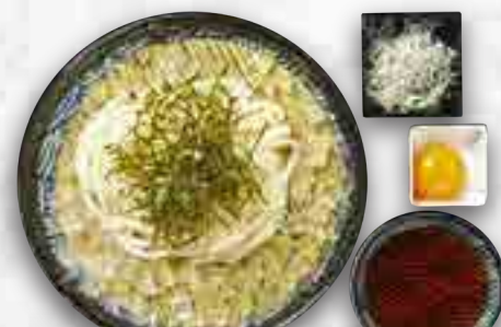
ざるのおうどん 680円