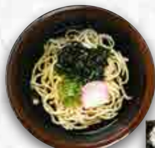
大和わかめのおうどん 580円