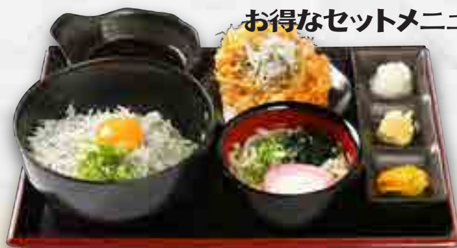
しーらすスペシャル御膳 1,680円 (Wしらす丼・小うどん・しらすかき揚げ・漬物)