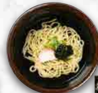
釜揚げしらすのおうどん 580円