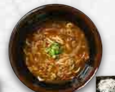
自家製カレーのおうどん 1,180円