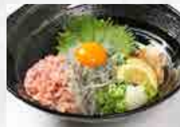
生しらす & ネギトロ丼 980円 大盛 1,180円