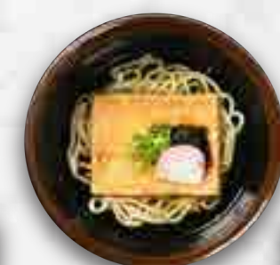
大判きつねのおうどん 680円