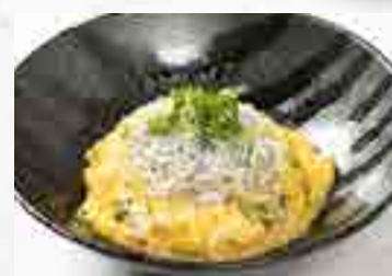
釜揚げの玉子とじ丼 880円 大盛 1,080円