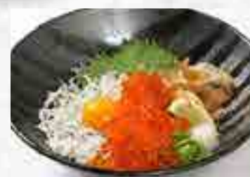
釜揚げしらす & いくら丼 1,380円 大盛 1,580円