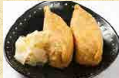
しらす入り稲荷寿司 380円