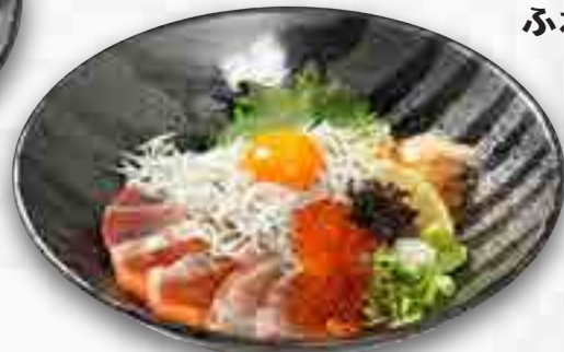
釜揚げしらす 特選海鮮丼 1,680円 大盛 1,880円