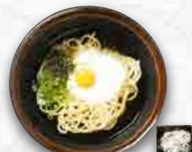
山かけのおうどん 780円