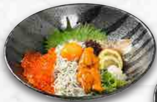
釜揚げしらす いくらういの3色丼 1,480円 大盛 1,680円