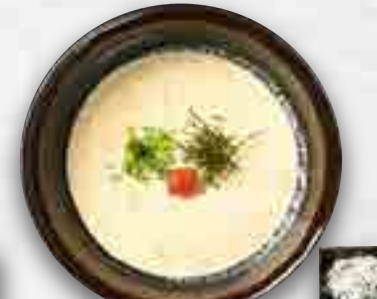
明太クリームのおうどん 1,280円