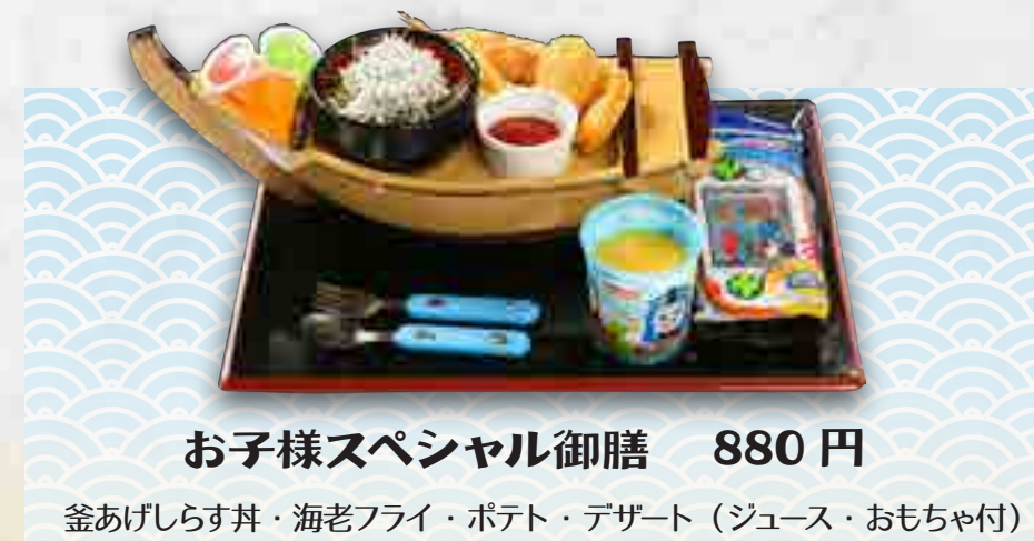
お子様スペシャル御膳 880円