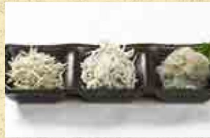
しらすの三種盛合せ 480円