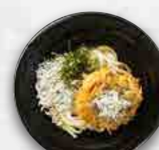
しらすかき揚げのおうどん 冷たいおうどん 880円