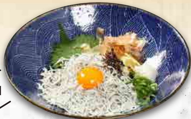
ふわふわすぎる釜揚げしらす丼 780円 大盛 980円