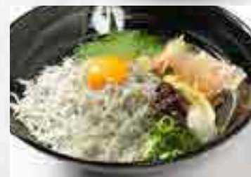
生しらす釜揚げしらす W 丼 980円 大盛 1,180円