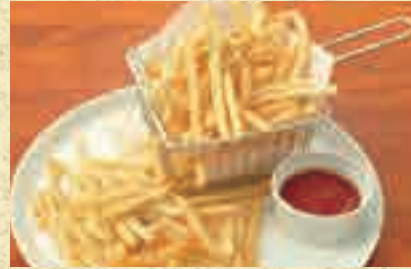
フライドポテト 380円