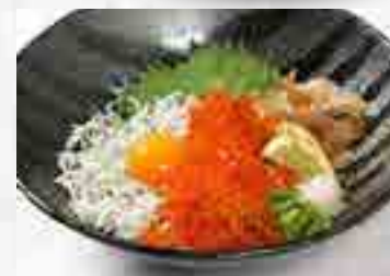
Wしらすといくら の3色丼 1,480円 大盛 1,680円