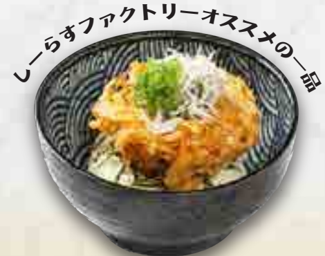
しらすかき揚げ丼 880円 大盛 1,080円