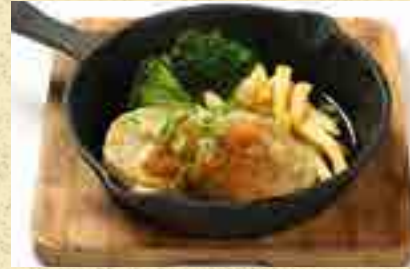
しらすハンバーグ 680円