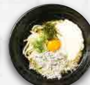
山かけのおうどん 冷たいおうどん 780円