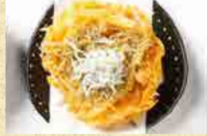
しらすのかき揚げ 480円