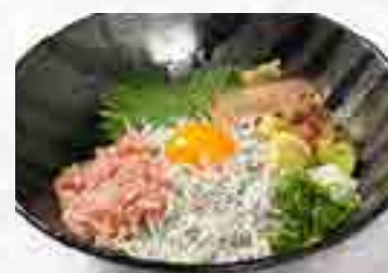
釜揚げしらす & ネギトロ丼 880円 大盛 1,080円