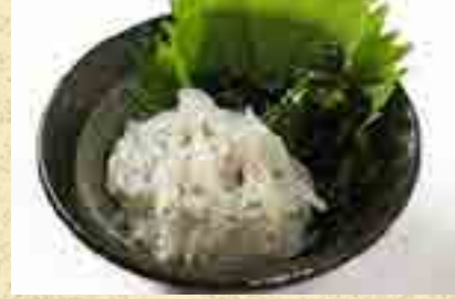
生しらすとわかめの小鉢 480円